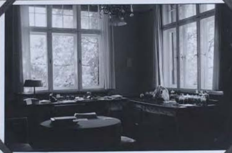
Hunt Institute for Botanical Documentation